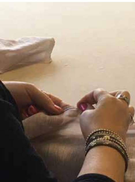
Vérifier les habiletés manuelles