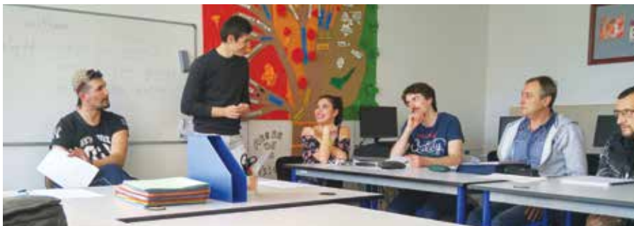
* L'Unité d'Évaluation, de Réentraînement et d'Orientation Sociale et professionnelle – UÉROS Midi-Pyrénées

Retrouver une perspective et un emploi adapté, le défi à relever est partagé par les stagiaires eux-mêmes mais aussi par tous ceux qui, à leurs côtés, au sein de l'UÉROS, en ont fait leur métier... et leur mission.